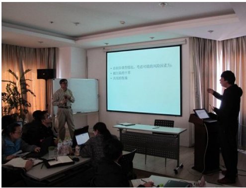
暴发调查练习汇报