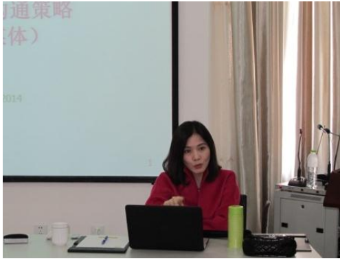
风险沟通策略专题