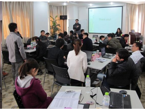
媒体沟通模拟练习