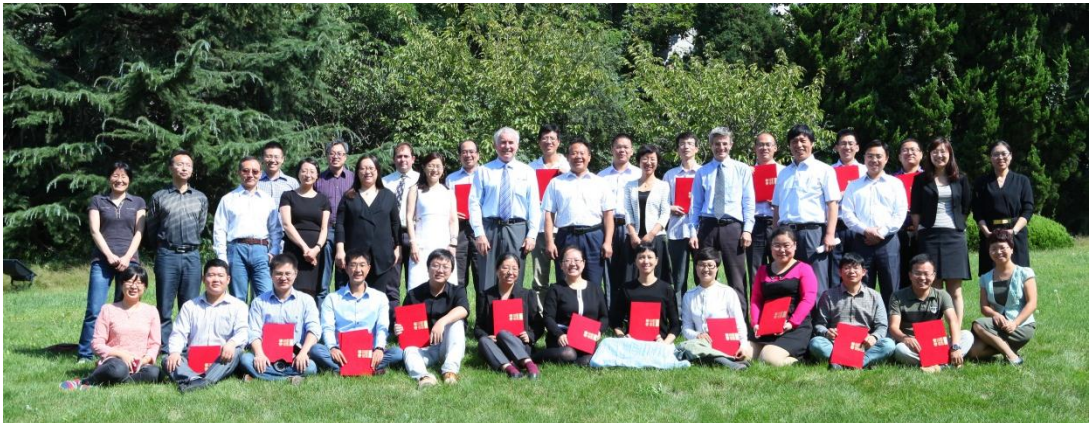
第二期 CFETPV 毕业合影