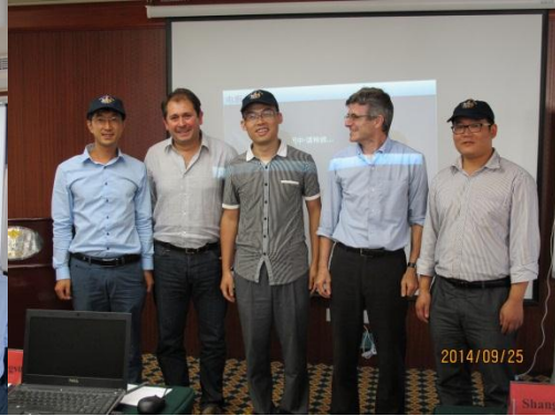
成绩优秀学员与老师合影